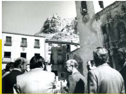
Localització de la Casa de l'Assegurada per a seu del Museu, 1976.

col·locació de les obres, els marcs, el fullet, el cartell anunciador, les invitacions... tot el que calia per a convertir el museu en una obra pròpia.