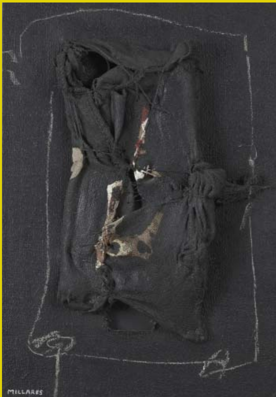
Manuel Millars, "Santa Faç", 1960-65. Col·lecció Art Segle XX. MACA, Museu d'Art Contemporani d'Alacant.

Coneixem la devoció especial que Sempere dispensava al llenç, devoció que el va portar a encarregar a l'informalista Manuel Millars una obra amb aqueix tema. La peça que avui es guarda en els fons de la Col·lecció Art Segle XX i exposada en el MACA, Museu d'Art Contemporani d'Alacant, és una bellíssima creació de l'artista canari on el referent de la Santa Faç es converteix en una imatge poderosa, una pasterada d'arpilleres i cordes retorçades i pintades de negre esguitades amb el roig de la sang del rostre diví; una magnífica representació de la mort viva plasmada tant en un tros de tela com en les imatges de fe dels creients.