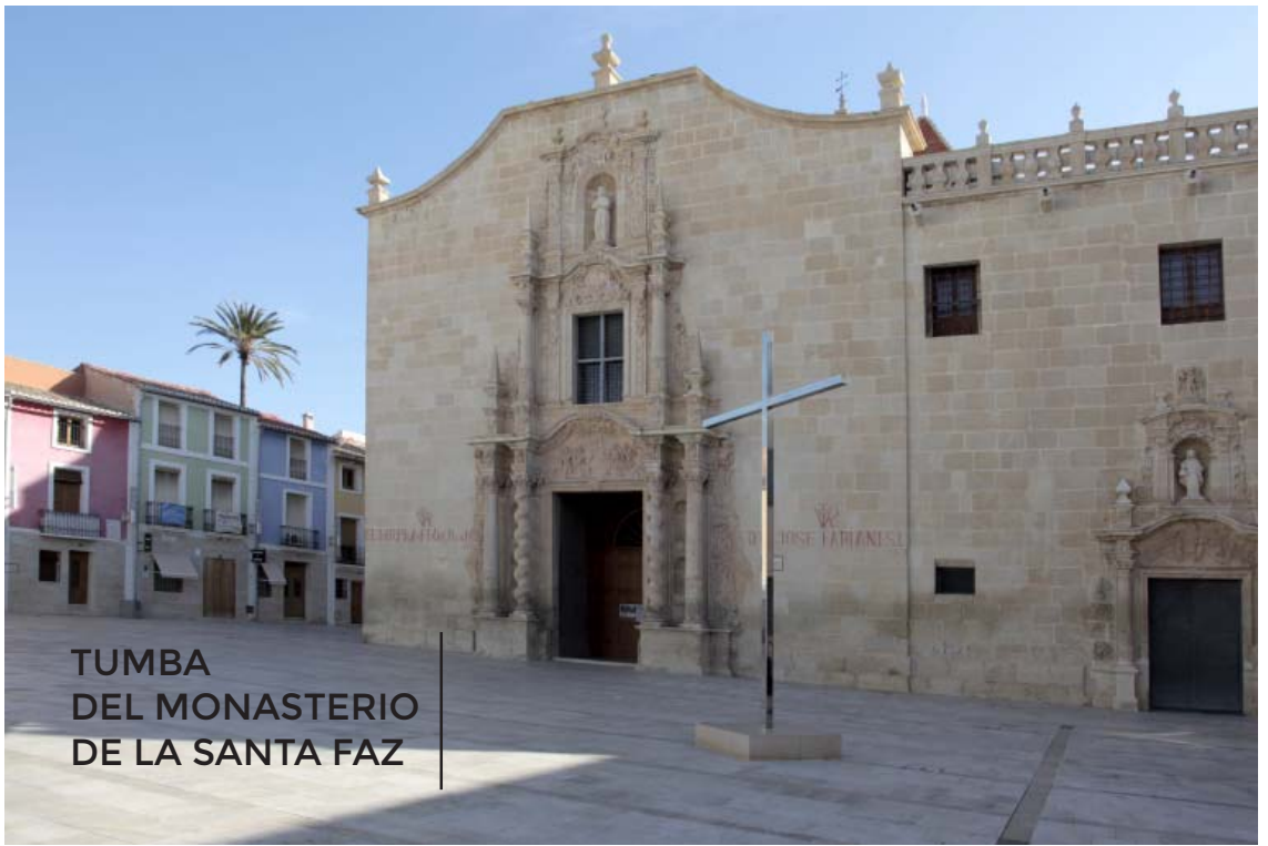
TUMBA DEL MONASTERIO DE LA SANTA FAZ