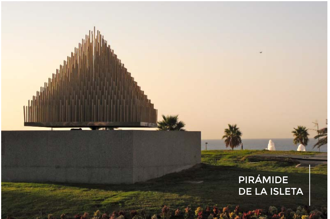
PIRÁMIDE DE LA ISLETA